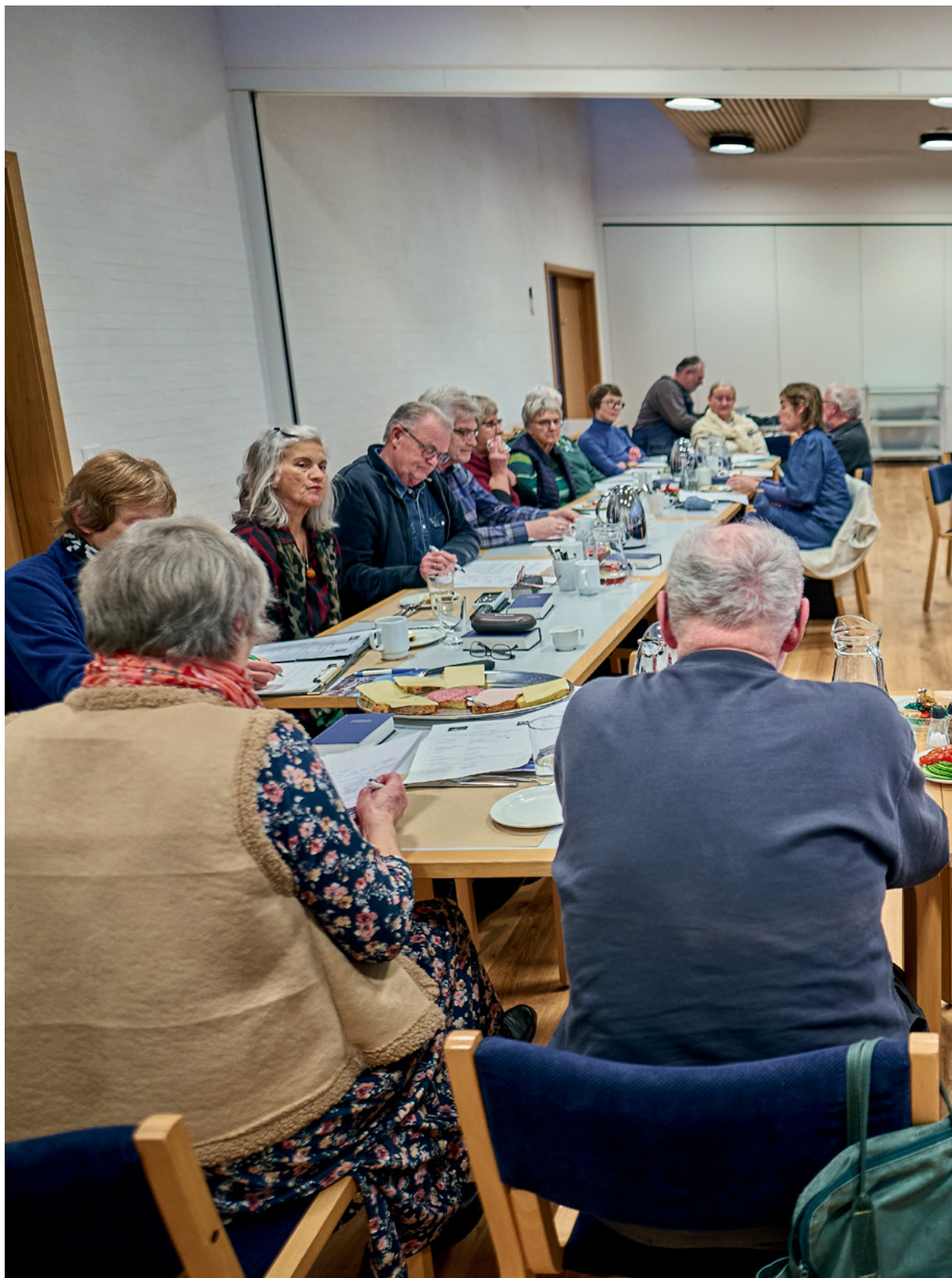
Der er fuldt hus, når menighedsrådet i Lumby og Stige Sogne holder møde